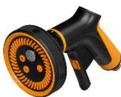
Comfort Pistolet zraszający, multi (Front) ok. 136 zł