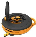
Bęben z węzłem S ok. 435 zł

Zdjęcia produktowe i orientacyjne ceny detaliczne: